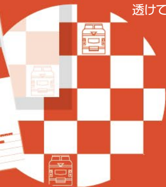
テ120 ふみ鉄®レターセット 【レトロ】