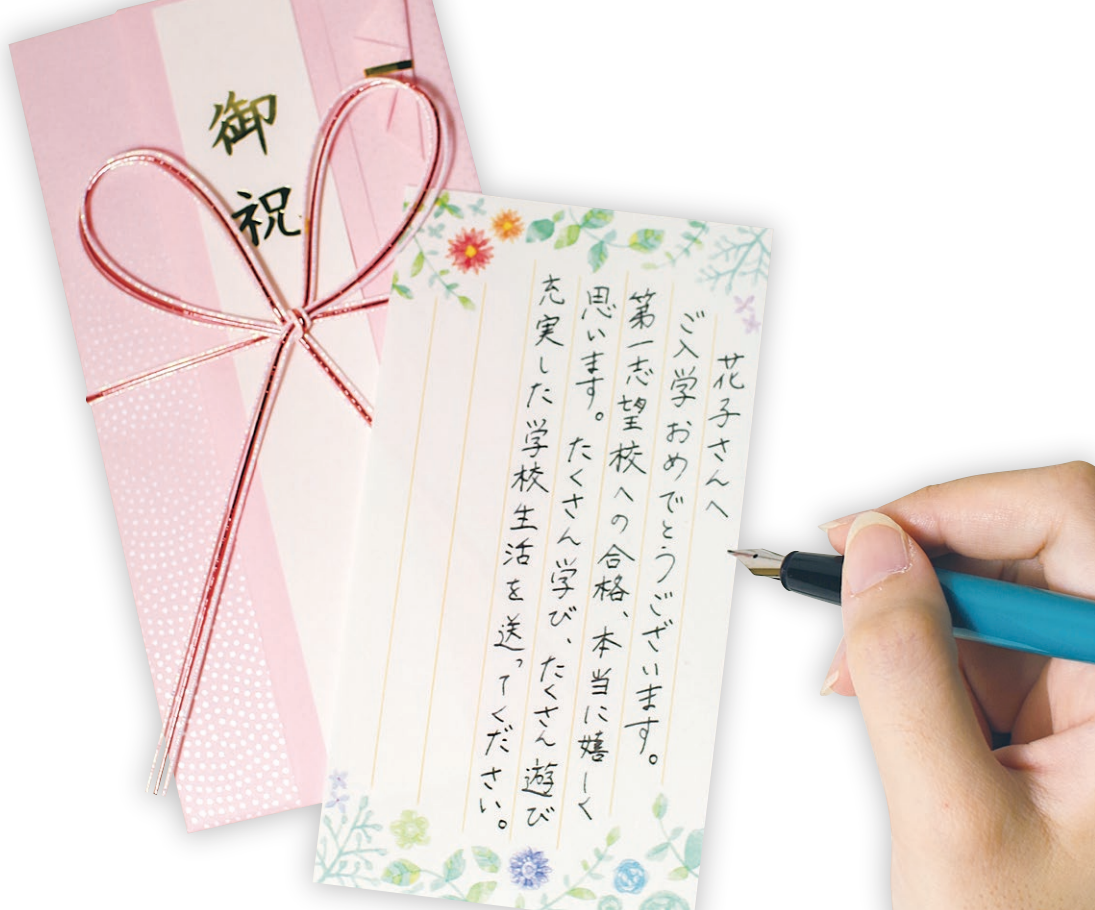
ひとふみ箋 いちご